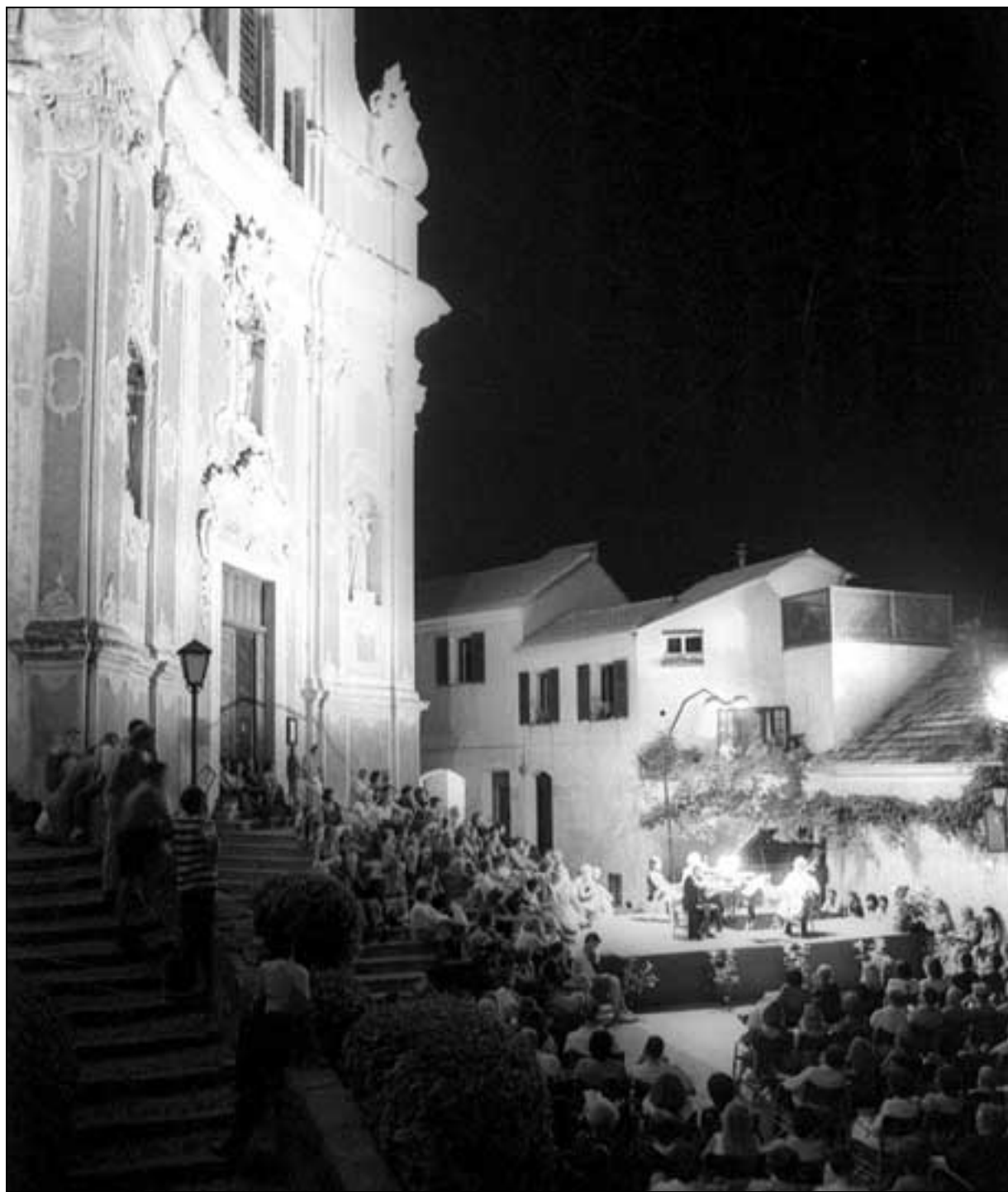
Una suggestiva immagine serale del sagrato della Chiesa dei Corallini a Cervo, dove si svolge il Festival