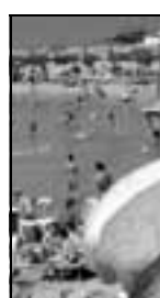
I Tre Ponti

Anche a Imperia animazione, musica, ballo e divertimento questa sera allo Zanzibar ,