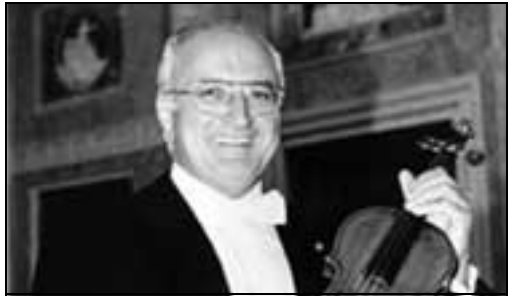
Il grande violinista Salvatore Accardo

Il grande violinista, tra i più apprezzati d'Europa, che è già stato protagonista del festival internazionale, sarà accompagnato al pianoforte da Giorgia Tomassi. Previsto un servizio di bus-navetta